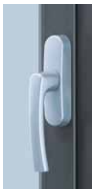
RotoLine Mécanisme intégré sans rosette