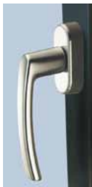
RotoLine Poignée de fenêtre