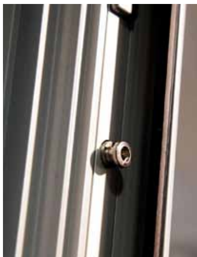
Sécurité élevée pour la classe de résistance 2 grâce au goujon de sécurité réglable

Qu'il s'agisse d'ouvrants de taille standard ou de solutions architecturales personnelles, AluVision Designo offre la solution parfaite pour chaque besoin. Le système de ferrures est confronté à des défis particuliers posés par des formats très étroits et hauts. L'utilisation de la paumelle OF avec rainure accrochable garantit l'étanchéité maximale de l'ouvrant sur le côté de la paumelle, même sur des systèmes de ferrures entièrement invisibles. Le limiteur d'oscillation en option (freiné et amorti) servant à limiter la largeur d'ouverture offre de nouveaux domaines d'application pour répondre aux exigences les plus élevées.