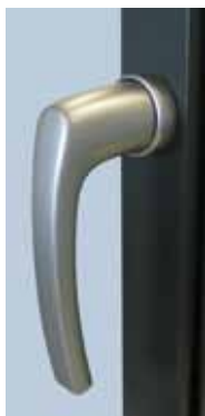
RotoLine Poignée de fenêtre sans rosette