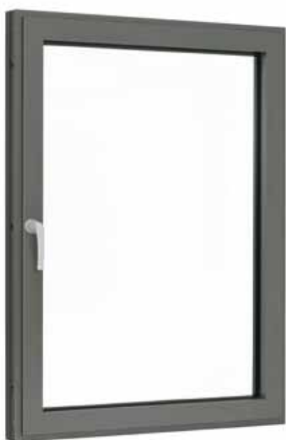
Fenêtre en aluminium avec Roto AluVision Designo et paumelles invisibles

Autre avantage lié à la construction : l'ouvrant ainsi ouvert n'encombre pas autant le champ de vision que dans le cas des fenêtres en aluminium traditionnelles à ferrure camouflée.